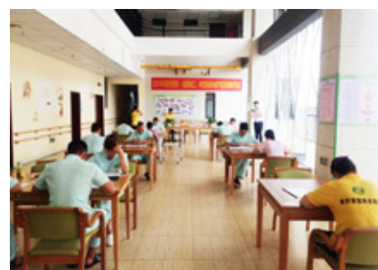
护理员认真完成试题考核

护理人员的任职资格，由美好家园养老集团人力资源部和培训学校颁发“养老护理员技能等级考试合格证书”，证明护理人员的学识和照护技能水平。保证了老人享受到专业“技术好”的服务，践行美好家园养老集团“八好服务”的质量。