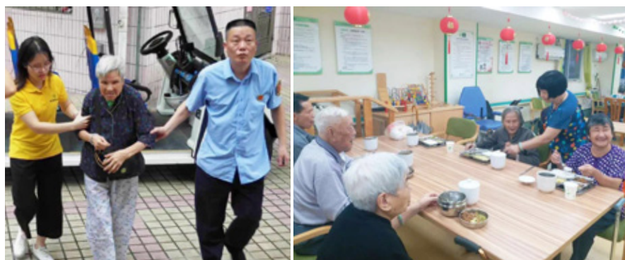
美好家园工作人员接长者至综合服务中心，并妥善安排饮食起居