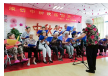
高龄合唱团倾情演唱