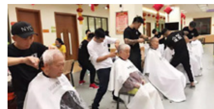
长者踊跃、有序地参加义剪活动

理发过程中，美发师们不忘与长者聊聊家常，分享头部的简单护理小常识，让爷爷奶奶们在轻松愉快的氛围中迎接期待已久的新发型。义剪活动在发型师与众长者的欢乐合影中圆满结束。