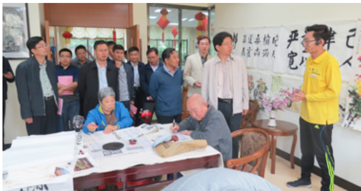
王昌林（右二）现场调研

【本报讯】（美好家园养老集团 杜浩冉）9月12日，国家发改委宏观经济研究院常务副院长王昌林一行21人，为指导编制《兰州市国民经济和社会发展中长期规划》莅临美好家园（兰州安宁）孝慈苑养老服务中心现场调研。兰州市