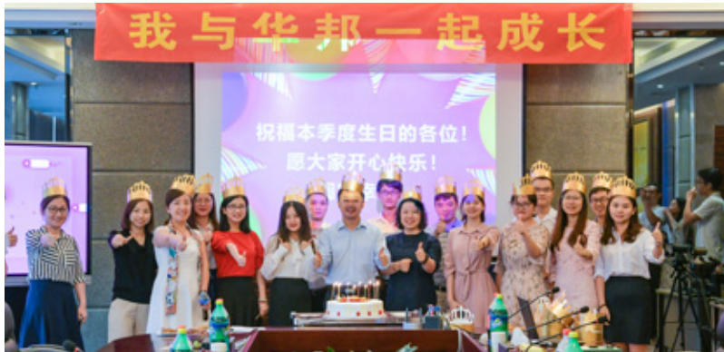
各单位第三季度寿星合影