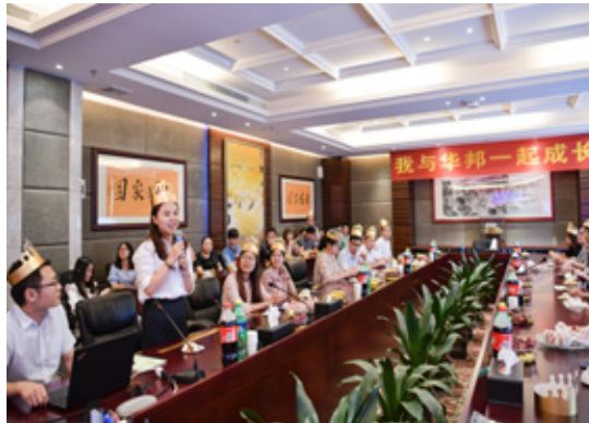
寿星发言，现场其乐融融