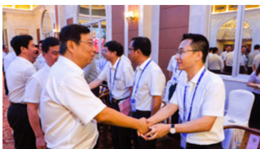
赵乐秦（左一）与李遂（右一）会议现场交流

广西壮族自治区人大常委会副主任、桂林市委书记、桂林市人大常委会主任赵乐秦表示，桂林市按照“新区做加法，