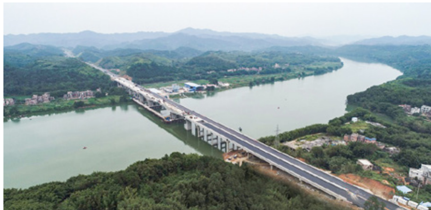
成功合龙的广西梧州仁义桂江特大桥

仁义桂江特大桥左幅桥梁全长781.99米，右幅全长872.45米，横跨桂江，河流降坡大，雨季时洪水凶猛，日常水流湍急，地质复杂，主桥6个主墩位于深水位。项目部克服重重困难，精心组织，科学调度，严格内部管理，西部中大人用智慧和汗水，于7月15日合龙大桥右幅中跨，防撞护栏和沥青路面的施工也随后完成。左幅中跨此时按节点成功合龙，为整座大桥的竣工