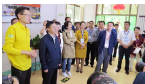
观摩团参观孝慈苑

首家“公建民营 医养结合”智慧养老试点基地，以医疗医养结合，开启“医养结合”探索试点工作。以构建社会养老与医疗保障充分融合的医养结合新格局，实现了老有所养、老有所医的双重目的，为推进健康甘肃的建设做出了积极贡献。