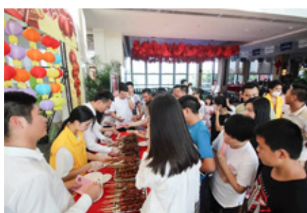
湛江休闲康养小镇活动现场人潮涌动

化盛宴庆中秋。游客中心秒变大戏园，大家热闹地围坐一堂，角儿登台声腔起，细细品味满堂喝彩。小镇里灯笼高挂，万家