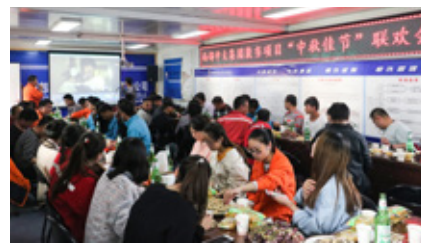
敦当项目中秋联欢晚会热闹非凡

另讯：中秋，是每一个华夏儿女共同期盼的传统节日。在这个特殊的日子，西部中大建设集团为各项目部为坚守岗位的一线人员举行了形式多样的中秋联欢活动，大家欢欣相聚，场面热闹非凡。