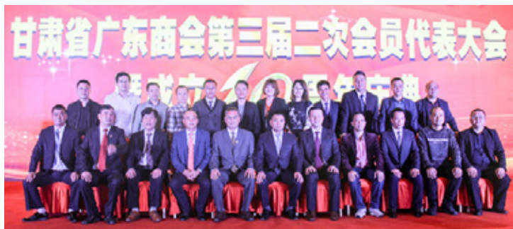
甘肃省广东商会会员代表大会合影