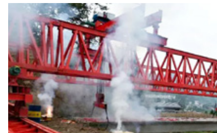
朱家堡大桥第一片箱梁架设

朱家堡架桥机箱梁架设，意味着平镇高速No 4 合同段全线步入了项目施工新阶段，为早日实现半幅贯通提供了有力保障。项目部将继续攻坚克难，努力做好后续箱梁制作、运输、架设等各项工作，脚踏实地，砥砺前行，为圆满完成工程任务而不懈努力。