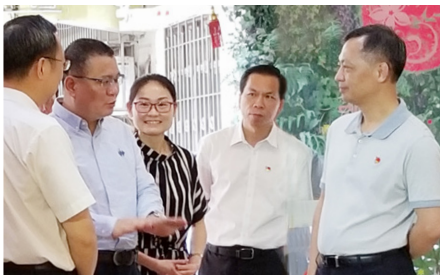
张硕辅（右一）再度深入美好家园（广州东湖西）孝慈轩走访慰问，为院内的长者及员工带来了节日的问候，表达党和政府的关怀

古人说，为生民立命，为万世开太平。一个社会的发展，总是需要有一些守望者，他们不仅关注眼前的得失，更要考虑长远的未来。应对老龄化冲击，正是着眼中国长远发展的未来大计。华邦控股集团旗下美好家园养老集团，是中国最早开始进入老龄产业