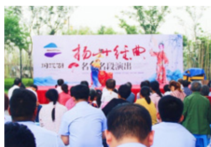
扬州文旅康养小镇文化盛宴现场

化盛宴庆中秋。游客中心秒变大戏园，大家热闹地围坐一堂，角儿登台声腔起，细细品味满堂喝彩。小镇里灯笼高挂，万家