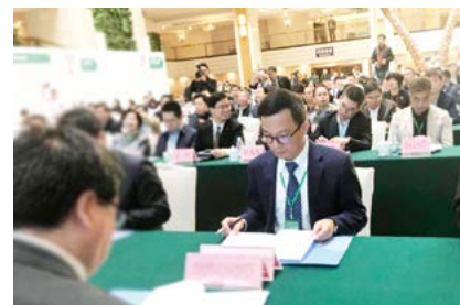
杨川代表企业与桂林市政府签约

是桂林选择了华邦控股，是健康中国选择了桂林山水。一个令全世界向往之的生态美城，一个引领中国康养产业方向的旗舰企业，在2018年的阳春三月，开启了一场向着春天与健康的美丽旅程。当华邦控股的经营理念与桂林的秀丽山水相结合，当美好家园养老集团的康养服务与“全球最佳旅游地”的绿色生态相融合，不仅会实现“绿水青山就是金山银山”的理念，而且会让绿水青山推动建设健康中国。