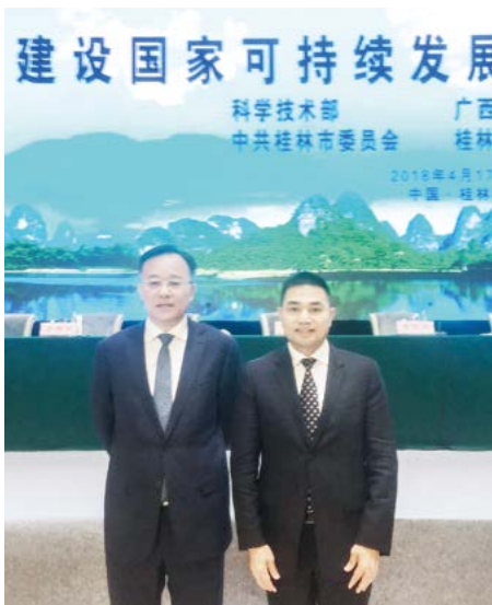
广西壮族自治区人民政府副主席黄俊华（左）与苏如春在签约现场

基地建设的目标任务高度契合，要统筹推进推进路径和项目建设，推动桂林实现高质量可持续发展。桂林人民有着深厚的漓江情结、山水情结、生态情结，长期以来对“绿水青山就是金山银山”有着成功的实践探索，也有着更美好的期待。