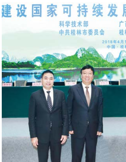
广西壮族自治区人大常委会副主任、桂林市委书记赵乐秦（右）与苏如春在签约现场